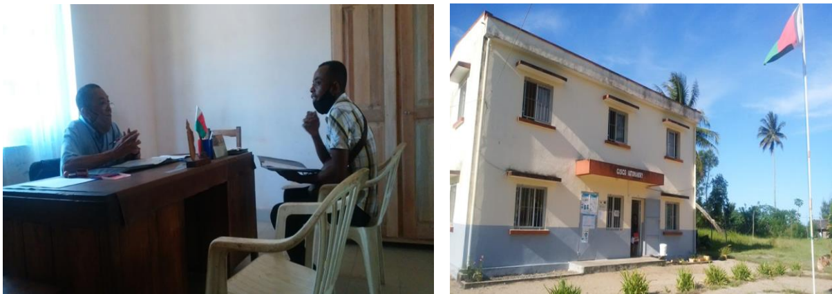
2. Figur: Höflichkeitsbesuch beim Bürgermeister von Vatomandry

Zwei Mitglieder der NRO Jade haben sich zur Erkundung der Umstände einer möglichen Durchführung der Strandreinigung in Vatomandry dorthin begeben. Nach Einholung einer amtlichen Erlaubnis seitens der Kommune, machten sie sich auch zum dortigen Schulamt auf, um für die mögliche Beteiligung der Schüler zu werben. Nachdem diese ebenfalls zugestanden wurde, suchten sie den direkten Kontakt mit den Schulen vor Ort, die sich allesamt interessiert gaben mit Ausnahme des städtischen Gymnasiums, weil dieses zur beabsichtigten Zeit einige Nachholprüfungen angesetzt hatte.