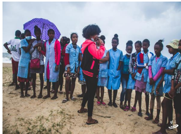
3. Figur: Strandreinigung und Einweisung der Schüler

2. Tag (22. Juni 2021): die Teilnehmer von Jade – 17 Freiwillige und 4 Mitglieder – gaben den 59 Schülern des CEG de Vohitsara und den 60 Schülern des CEG d’Ambilakely, die an diesem Tag samt ihren Betreuern an den städtischen Strand gekommen waren, die für das Projekt notwendigen Anweisungen zur Umsetzung durch. Aber die « Initiatives Océanes 2021 » bestanden nicht nur in der rund zweistündigen Strandreinigung, sondern auch in mehreren öffentlichen Demonstrationen, wie Müll getrennt und auch recycelt werden kann. Nach einer kleinen Erfrischung seitens der Schüler und dem Mittagessen seitens der Teilnehmer von Jade begaben sich diese wieder auf den Heimweg nach Tamatave.